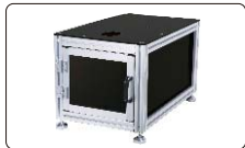
硬度计工作台(选配)